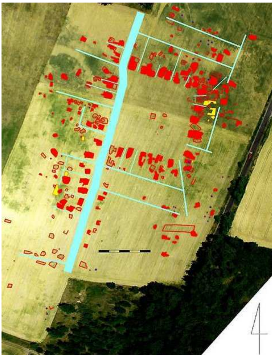
Lotnicze zdjęcie osady Stare Szamotuły z zaznaczonymi obrysami budynków i dróg.

przekopywania terenu. Teren obecnie objęty jest ochroną jako rezerwat archeologiczny. Odkrycie jest dużą szansą na rozwój miejscowości i całego regionu. Odpowiednie jego wykorzystanie pozwoli pobudzić ruch turystyczny i stworzy unikalne miejsce dla badaczy, którzy będą tutaj mogli testować nieinwazyjne metody badawcze.