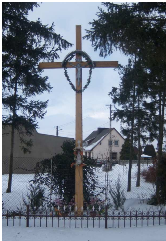
Krzyż przydrożny w Mutowie

Część budynków Stacji Hodowli Roślin Ogrodniczych użytkowana jest na potrzeby Gospodarstwa Rolno – Nasiennego i Stadniny Koni. Do lat 90 tych istniało w Mutowie przedszkole do którego uczęszczały dzieci w wieku od 3 do 6 lat (cztery grupy). Obecnie budynek byłego przedszkola przekształcony został na mieszkania socjalne (13 mieszkań) z wyodrębnioną świetlicą „klubem sołeckim”.