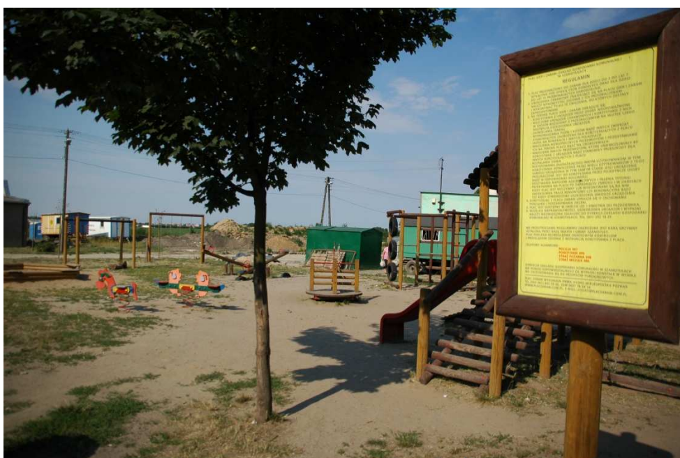
Plac zabaw w Mutowie

W 2006 roku w Mutowie powstał ze środków gminnych plac zabaw, wyposażony w liczne atrakcje dla najmłodszych mieszkańców