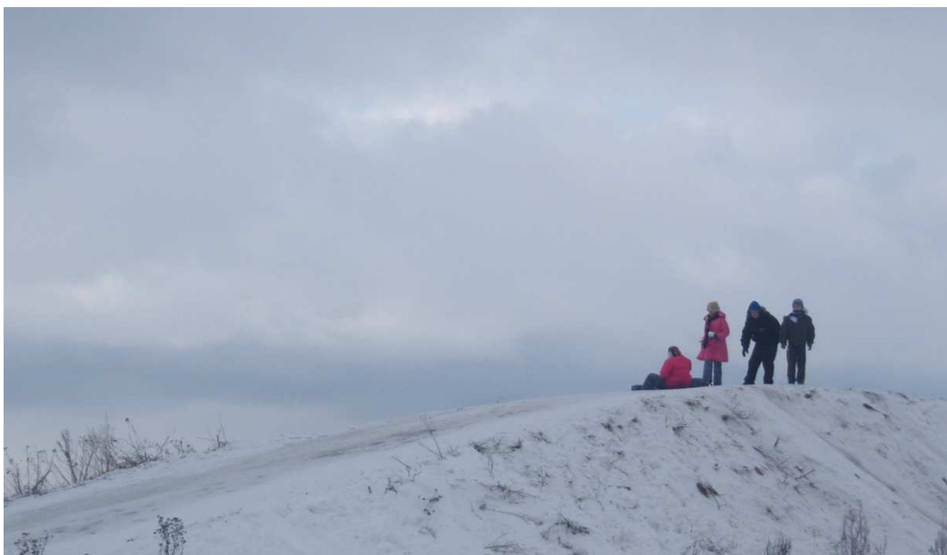
Górka saneczkowa w Mutowie

Na terenie Mutowa istnieje przystanek autobusowy do którego dojeżdża autobus podmiejski i szkolny dowożący dzieci do placówek oświatowych w gminie.