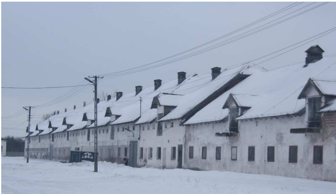
Budynki Gospodarstwa Rolno Nasiennego i Stadniny Koni

Część budynków Stacji Hodowli Roślin Ogrodniczych adoptowana został an potrzeby Gospodarstwa Rolno Nasiennego i Stadniny Koni.