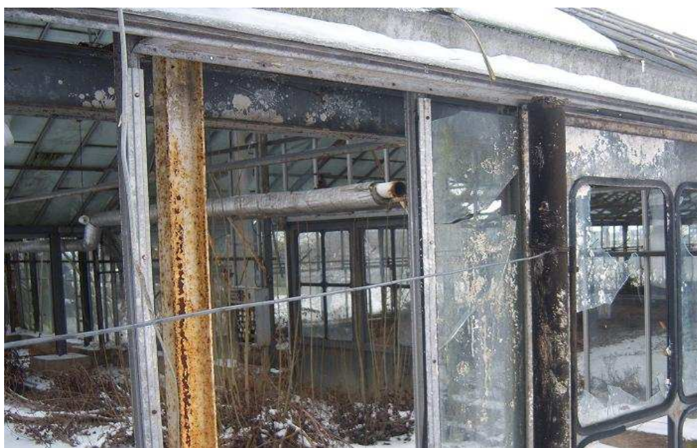
Dawna Stacja Hodowli Roślin Ogrodniczych

W tradycji lokalnej i niektórych zapisach Mutowo występuje jako Mątowo lub Muntowo. Wchodząca w skład sołectwa miejscowość Ludwikowo zwana także Łowizą lub Ławizą (dawna nazwa niemiecka Louisenhof). W toku opracowywania dokumentu nie natrafiona na wzmianki historyczne dotyczące Mutowa. W latach 1975 – 1988 miejscowość administracyjnie należała do województwa poznańskiego. Od roku 1952 do połowy lat 90-tych w Mutowie funkcjonowała Stacja Hodowli Roślin Ogrodniczych. Zakład podzielony był na trzy działki: ogólnorolny, hodowli i produkcji branżowej. Produkcja obejmowała przede wszystkim nasiona, cebulki i kłącza kwiatów w szklarniach i tunelach o powierzchni 4251 m 2 (głównie begonie, petunie, frezje, amarylisy, popielniki i lewkonie) oraz na polach (głównie gladiole, dalie, lwie paszcze, astry i bratki). Ponadto stacja zajmowała się produkcją nasion szpinaku (15ha), rzodkiewki (7ha), rzeżuchy (4ha), ogórków (8ha), groszku (40 ha). Dział ogólnorolny zajmował się również hodowlą bydła (350 szt. w tym 80 krów), uprawą zbóż, rzepaku, buraków cukrowych i kukurydzy. Stacja zatrudniała około 120 pracowników, w większości mieszkańców wioski. Obecnie tereny byłej Stacji Hodowli Roślin Ogrodniczych są w większości nieużytkowane, a stan techniczny części budynków wchodzących w jej skład jest katastrofalny.