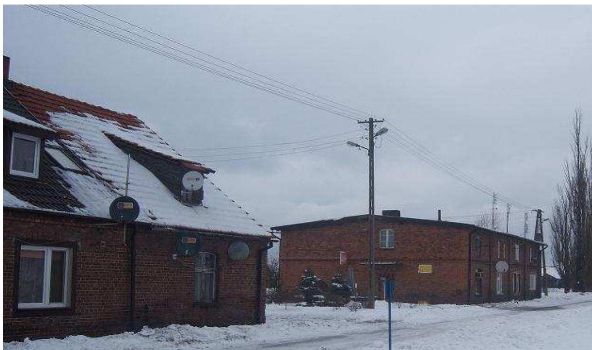
Stare zabudowania wsi Mutowo