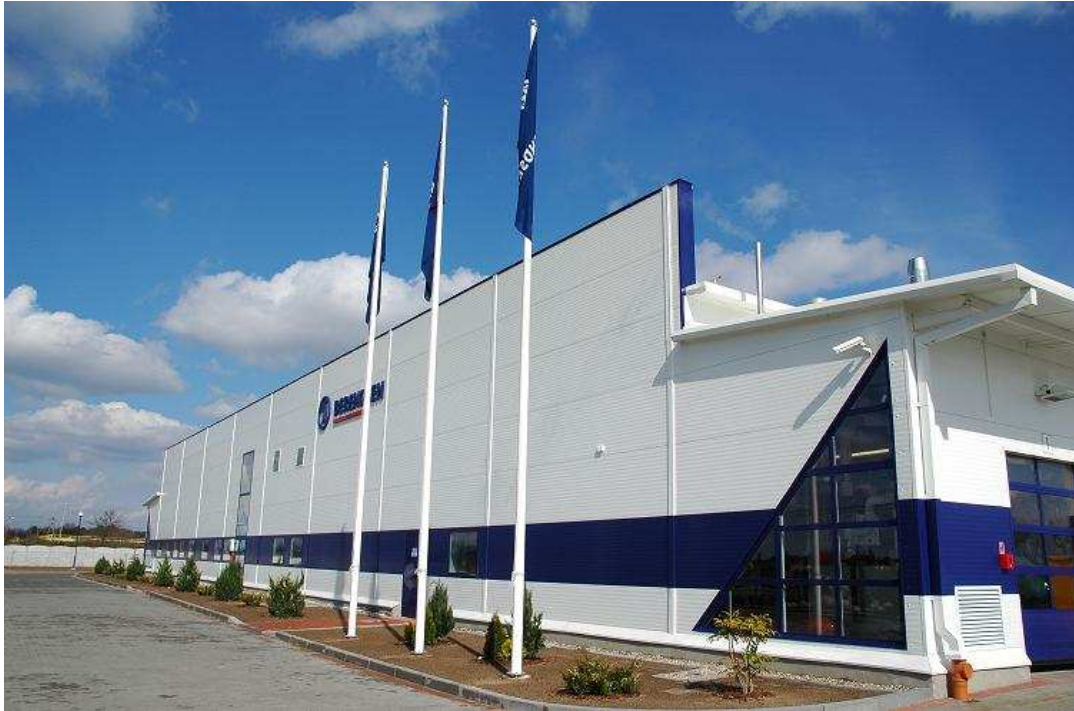
Berendsen Textile Service Sp. z o.o.

Wymienione wyżej inwestycję dobrze wróżą rozwojowi tego obszaru i oznaczają dla mieszkańców nowe miejsca pracy. W dłuższej perspektywie planowane kolejne inwestycję pozwalają przypuszczać iż to właśnie ten rejon gminy będzie rozwijał się najszybciej.