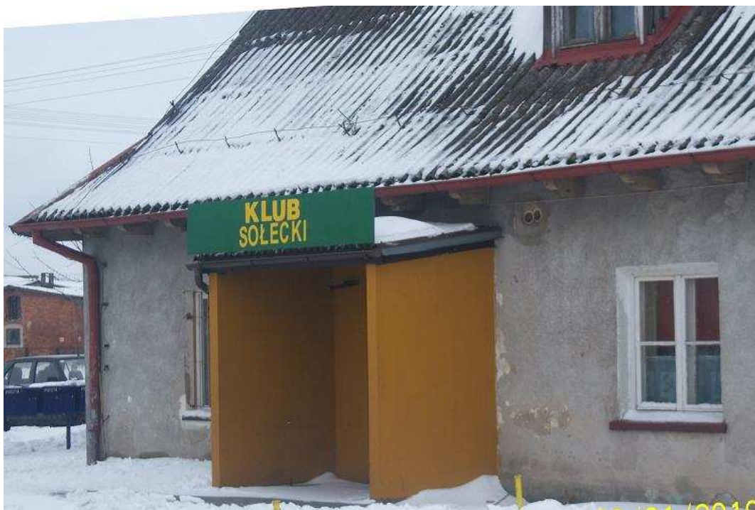
Klub sołecki w Mutowie

Na terenie Mutowa istnieje świetlica „klub sołecki” wyposażona w szafy, stoły, krzesła. Kuchnia w świetlicy wyposażona jest w lodówkę, zmywarę i piec. Świetlica pełni funkcję kulturalne, udostępniana jest na spotkania lokalnej społeczności. W świetlicy nie ma zatrudnionych pracowników, nadzór nad jej działaniem sprawuje sołtys.