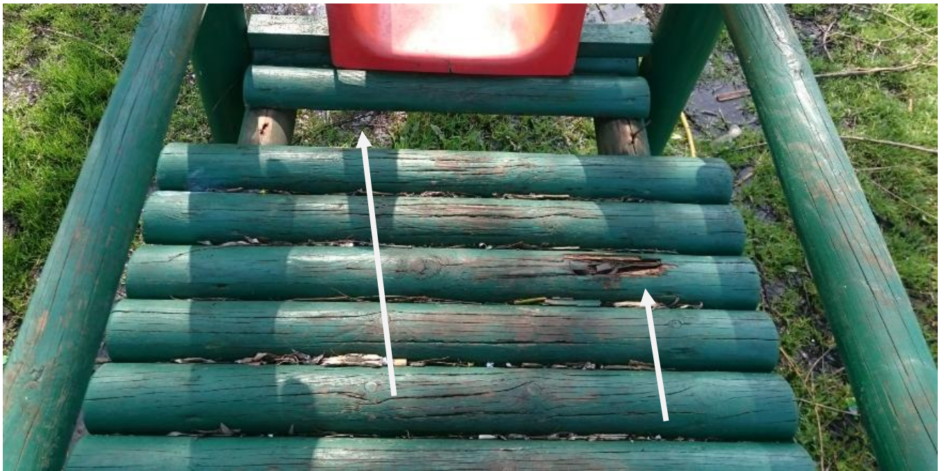
Brak deski i ubytek drewna